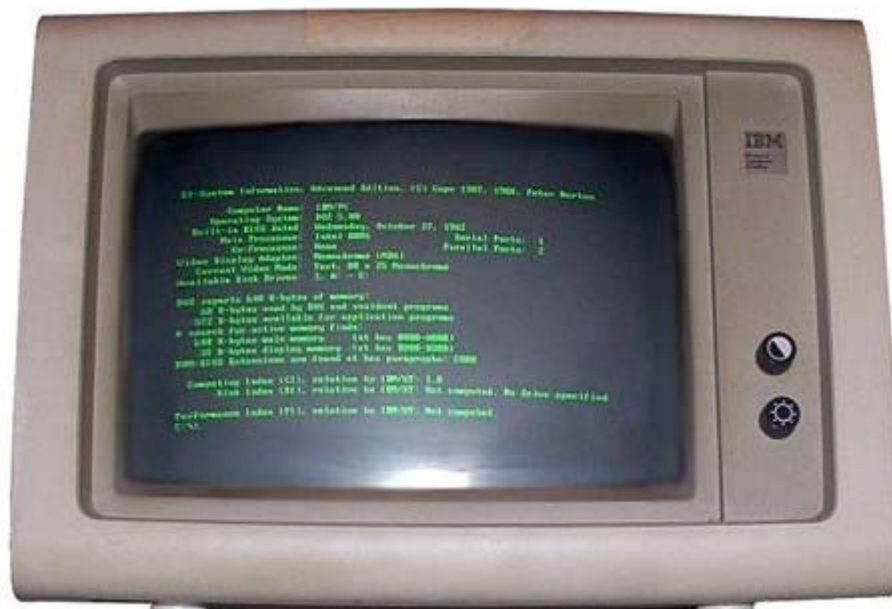
Modelo de monitor dos terminais utilizados pelas bibliotecas nas décadas de 70 e 80

Os sistemas desenvolvidos pelo NCE com grupos de bibliotecários do SiBI - Sistema de Bibliotecas e Informação da UFRJ, não atendiam plenamente as crescentes necessidades das bibliotecas. Os módulos não eram integrados, construídos em DOS, havia poucos terminais, monitores com “letras verdes”, com acesso lento aos conteúdos. Aparecia a mensagem “Aguarde, por favor!” nas telas.